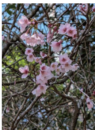
キンキマメザクラ