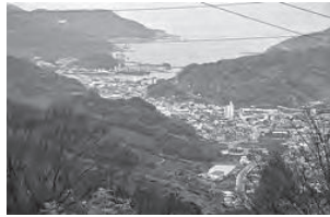
燕坂塔下王子を過ぎると長い下り。有田の街と港を望む