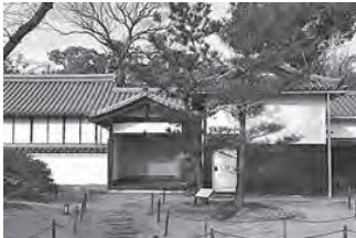
鈴木屋敷 藤白神社の境内に復元され公開されている