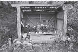
七丁目の地蔵さん

熊野古道の藤白坂 ▼丁石地蔵 藤白坂には峠まで一丁（約109m）毎に地蔵が計17体