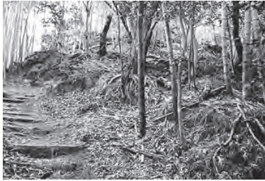
一壺王子跡 現在は山路王子神社。秋祭に小児の健康を願う「泣き相撲」を奉納

和歌山県海南市のJRきのくに線海南駅から、有田市の紀伊宮原駅までの「熊野古道」を歩く。王子（沿道の社）をたどりながら南進し、山道や農道、峠越え、みかん畑と変化に富む14キロ弱・5時間コースだ。随所に「熊野古道」の提灯が掲げられ、案内板も充実している。