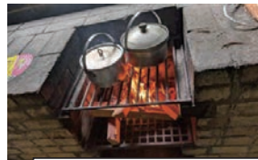
写真は、過去の一例です

【日 程】2026年8月22日(土)～23日(日) 1泊2日 【場 所】大津市立 葛川青少年自然の家(滋賀県大津市坊村) 【費 用】子供 1人4,500円 大人1人4,500円(同額です) (大津市民は 500円引き)