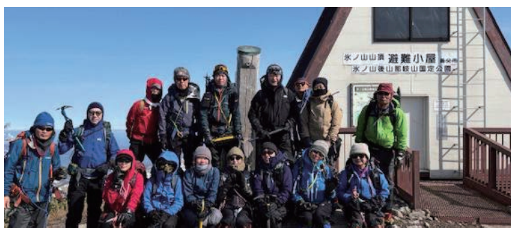
氷ノ山山頂で集合