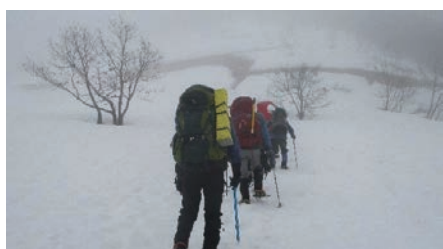
若狭町響きの森からの登り