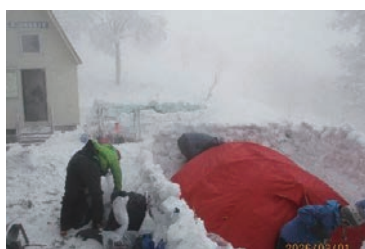
氷ノ山越でテント設営