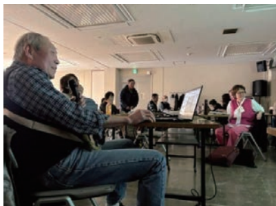
会員拡大について各会からの報告