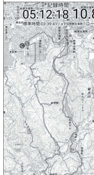
歩いたコース (神鉄鈴蘭台駅を基点に周回できます)