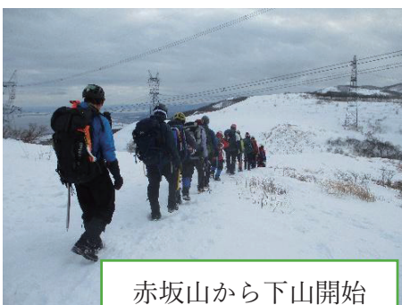
赤坂山から下山開始