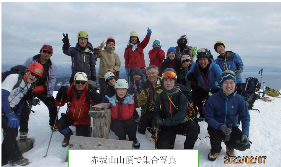
赤坂山山頂で集合写真