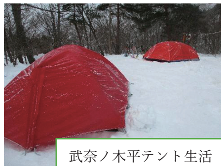
武奈ノ木平テント生活